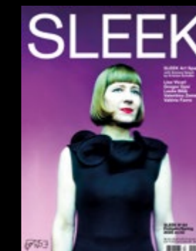
Styling YANNIC JOEL HOHAUS Hair and Makeup ANDREA YOUNG Dress NAOMI TARAZI Jewelry UNCOMMON MATTERS