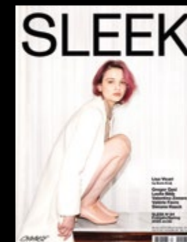
Styling ELISA SCHENKE Full Look FENDI SS25 Location THE SCHLOSSHOTEL BERLIN by Patrick Hellmann

SLEEK accepts no liability for any unsolicited material whatsoever. Opinions contained in the editorial content are those of the contributors and not necessarily those of the publishers of SLEEK. Any reproduction in whole or in part without written permission is strictly prohibited. SLEEK magazine and sleekmag.com are published by H&B Publishing GmbH, Alexanderstrasse 7, 10178 Berlin, Germany, info@sleekmag.com