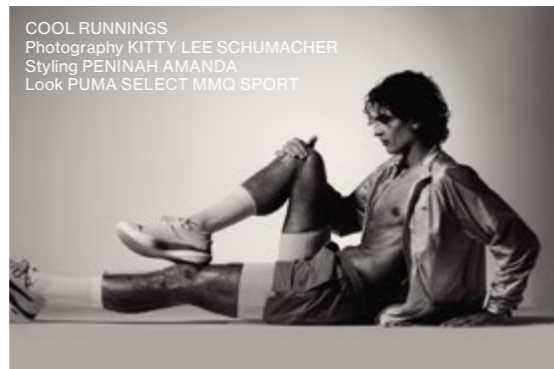
COOL RUNNINGS Styling PENINAH AMANDA Look PUMA SELECT MMQ SPORT