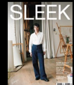
Styling TANIA AQUARO Full Look ARKET Shoes TALENT'S OWN