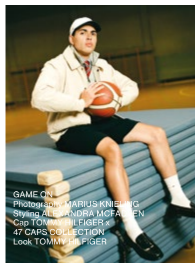
GAME ON Photography MARIUS KNIENING Styling ALEXANDRA MCFADYEN Cap TOMMY HILFIGER x 47 CAPS COLLECTION Look TOMMY HILFIGER