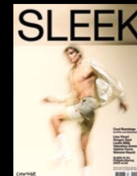
Styling PENINAH AMANDA Look PUMA SELECT MMQ Sport